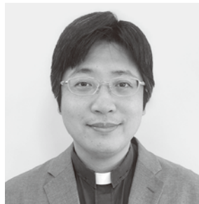
鴨島兄弟教会 牧師