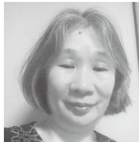
日本イエスキリスト教団 羽ノ浦キリスト教会 牧師