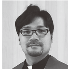
阿南福音ルーテル教会 牧師